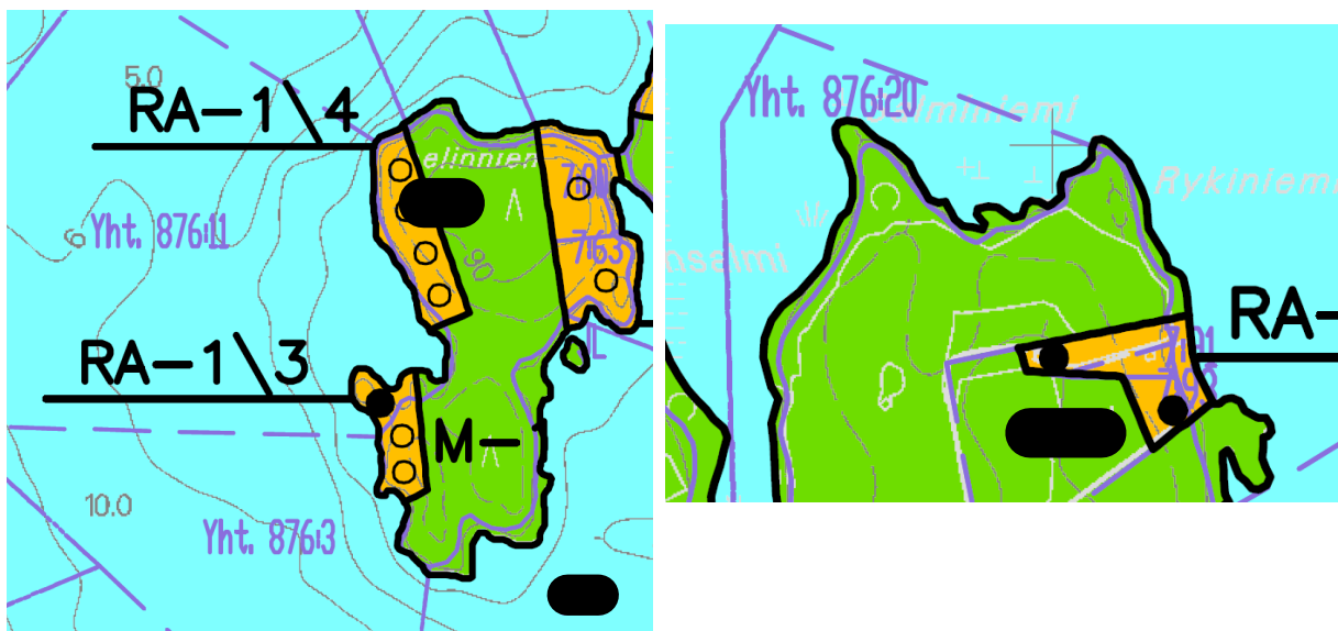
Kuva 4: Otteet voimassa olevasta yleiskaavasta: vasemmalla Jänissaari ja oikealla Martikkalansaari.

Suunnittelualueella on voimassa Onkivesi Nerkoonjärven rantaosayleiskaava, joka hyväksytty vuonna 2000. Kaavaan on tehty laajennus ja useita muutoksia, joista viimeisin on hyväksytty vuonna 2017.