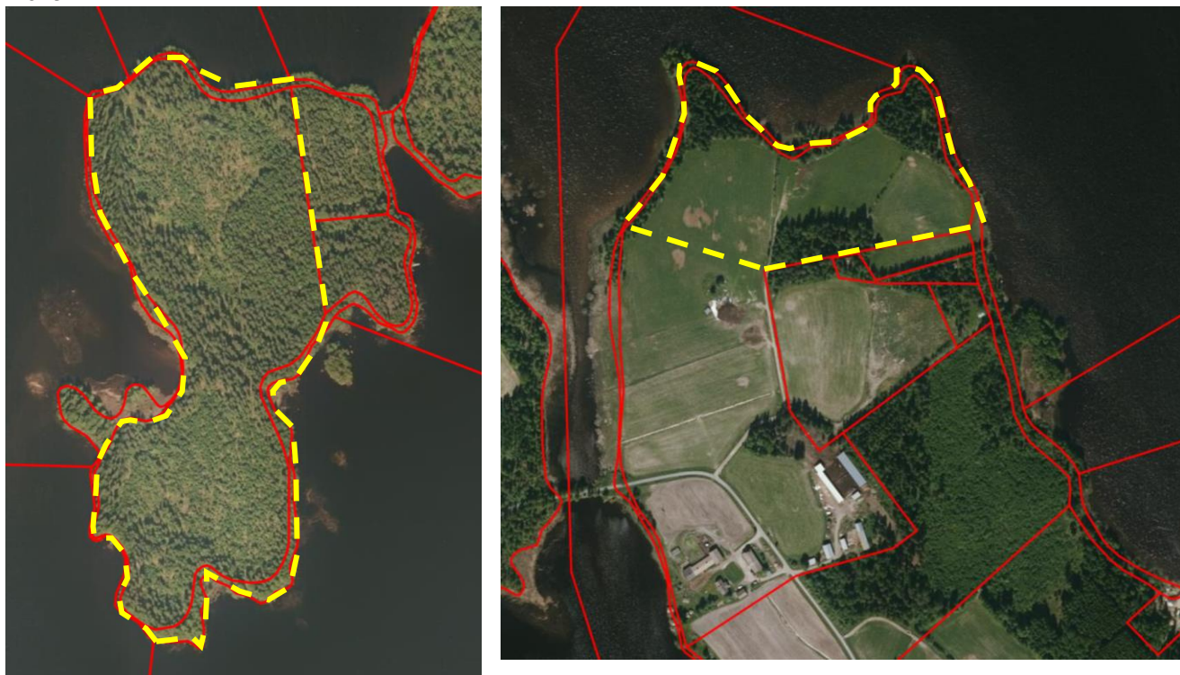
Kuva 2: Ortokuvat suunnittelualueesta: vasemmalla Jännsaari ja oikealla Martikkalansaari. Kiinteistörajat punaisella ja suunnittelualueen likimääräinen rajausta keltaisella katkoviivalla.