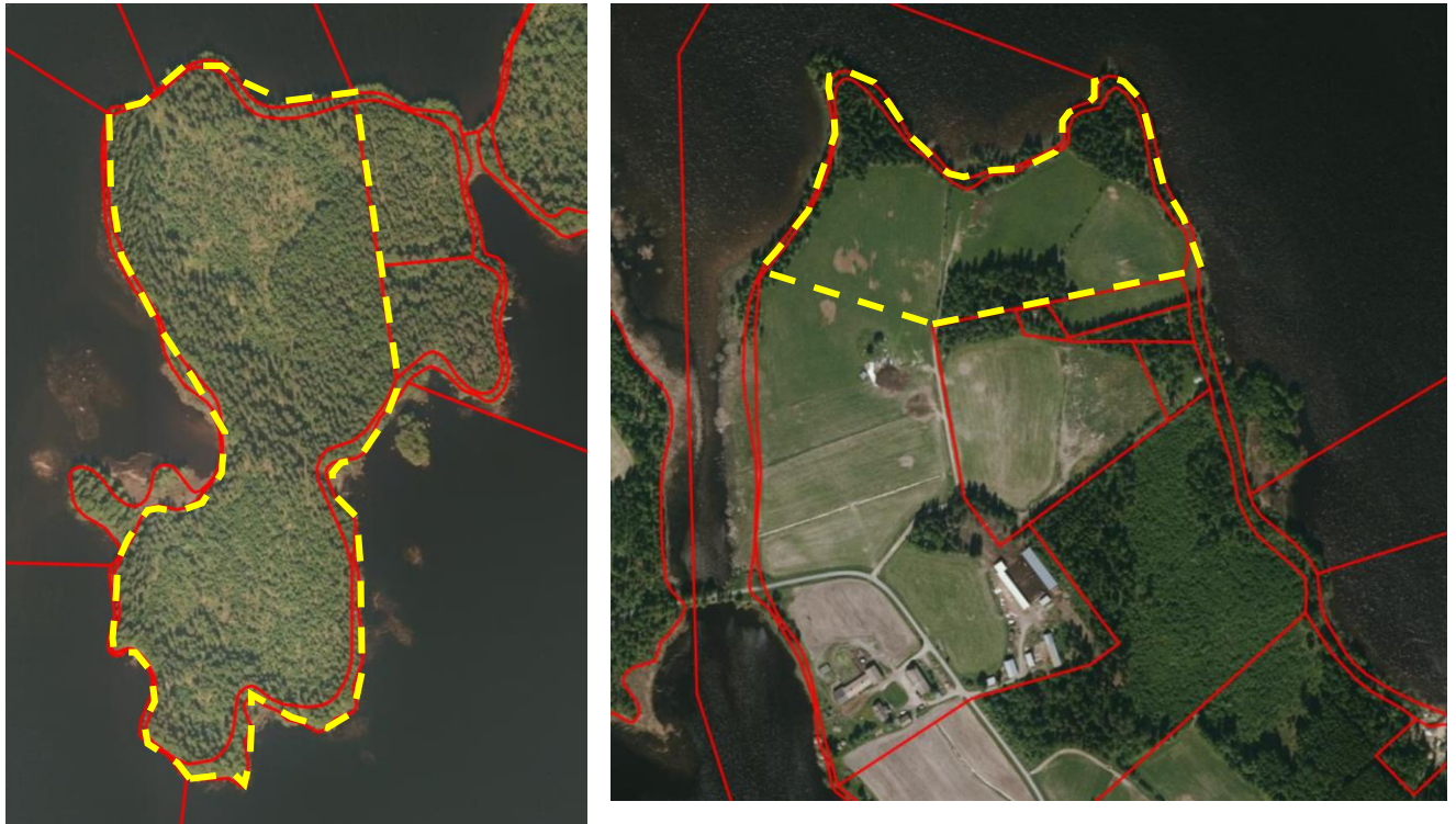
Kuva 2: Ortokuvat suunnittelualueesta: vasemmalla Jännsaari ja oikealla Martikkalansaari. Kiinteistörajat punaisella ja suunnittelualueen likimääräinen rajausta keltaisella katkoviivalla.