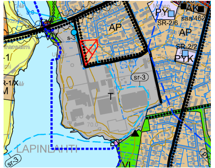
Ote kirkonkylän osayleiskaavasta