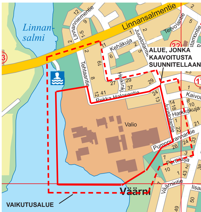
Alustava suunnittelualan rajaus